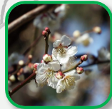
ウメ (花) 花は見つかるかな？