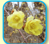
ソシンロウバイ (花) 香りのよい蠟細工のような花