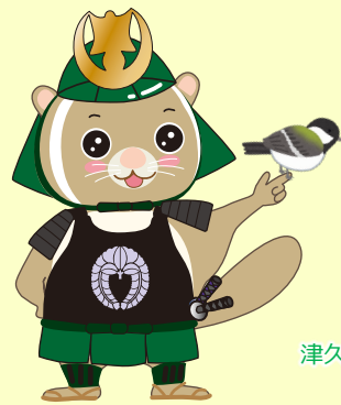
公園ゆるキャラ [武者さび君]